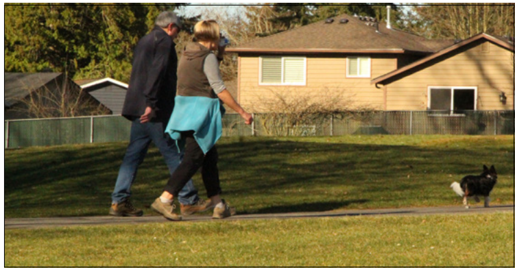
一对夫妇在 132nd Square Park 遛狗。

而柯克兰美国棒球联盟 (Kirkland American League) 则使用 Crestwoods 和 Everest 公园的八个场地作为基地，供其 57 个球队 685 名球员使用。